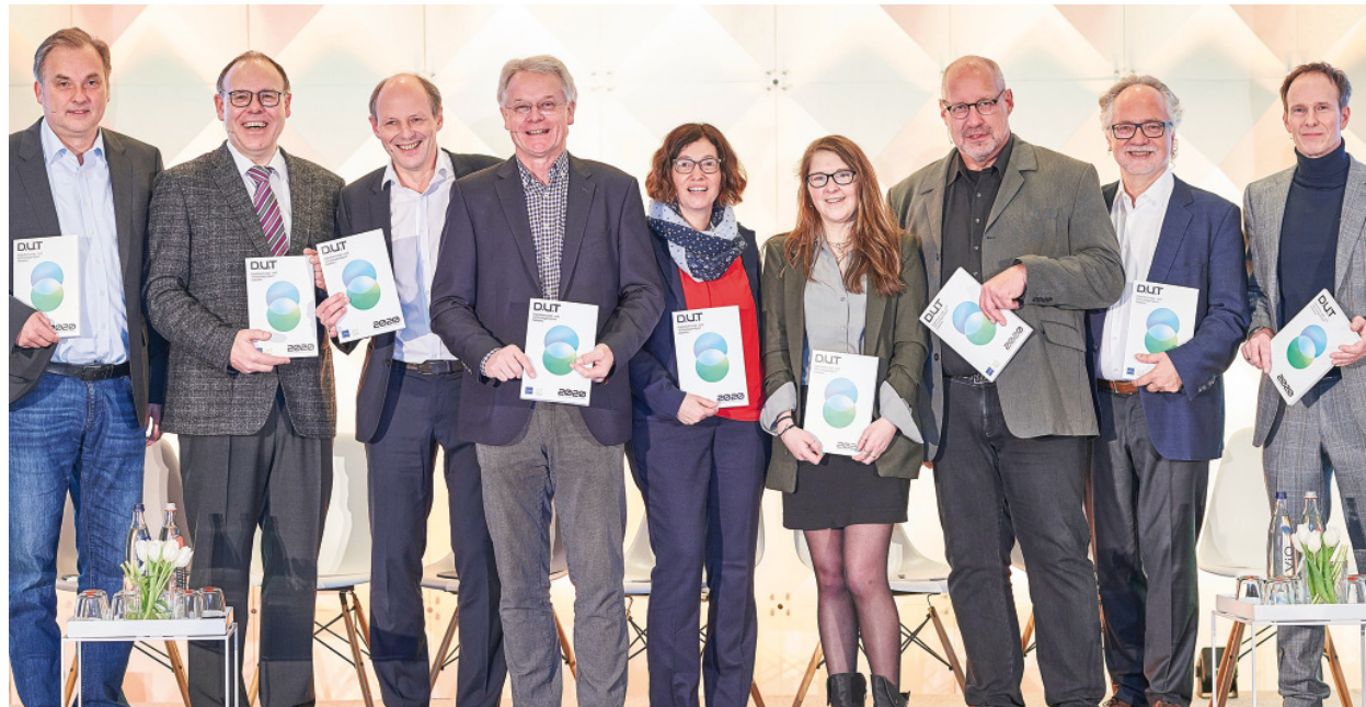
Das Zukunftsboard Digitalisierung mit niedergelassenen und klinisch tätigen Diabetologen, Experten für Diabetestechnologie sowie Vertretern von Krankenkassen und Patienten identifiziert aktuelle Trends und bewertet deren Nutzen für die Praxis.